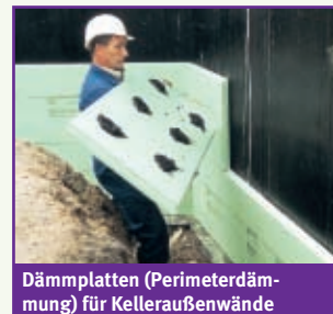
Dämmplatten (Perimeterdämmung) für Kelleraußenwände