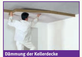
Dämmung der Kellerdecke

Wo der Keller am besten gedämmt wird, hängt von seiner Nutzung ab. Wenn er als beheizter Wohnraum dient, müssen Boden und Wände gedämmt sein. Bei einem unbeheizten Keller sollte die Decke gedämmt werden.