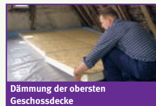
Dämmung der obersten Geschossdecke